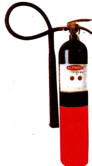
AL - 7C