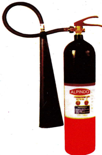
AL - 5C