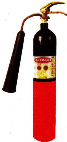
AL - 2C